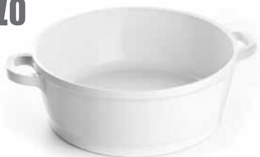
Casseruola con coperchio 20, 24 cm con rivestimento ceramico o antiaderente