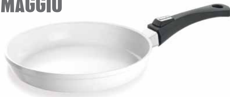
Padella con manico removibile salvaspazio 24, 28 cm con rivestimento ceramico o antiaderente