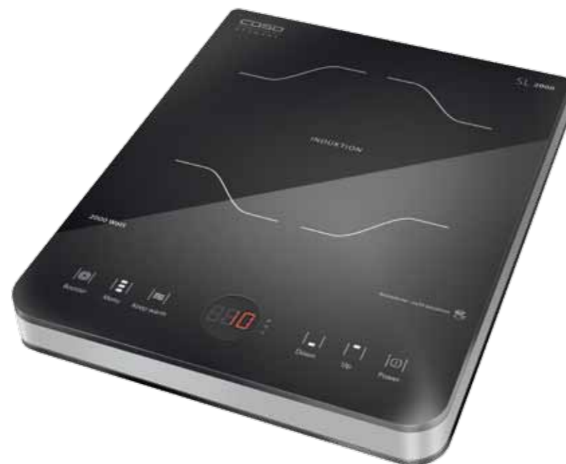
PIANO COTTURA PORTATILE CASO® GERMANY INDUKTION SLIMLINE 2000 Dimensioni: 27,4 x 5,8 x 35,6 cm