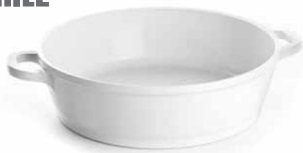
Tegame con coperchio 28, 32 cm con rivestimento ceramico o antiaderente