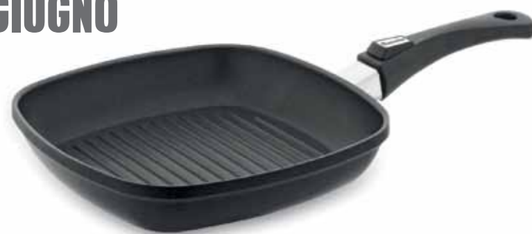
Bistecchiera 30 x 30 cm rivestimento antiaderente con manico removibile salvaspazio