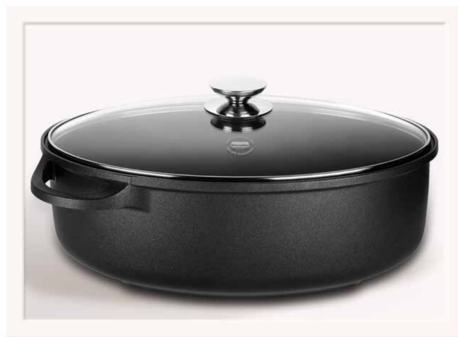
Linea SPECIALI: Rostiera ovale 38X24 cm e coperchio in vetro.