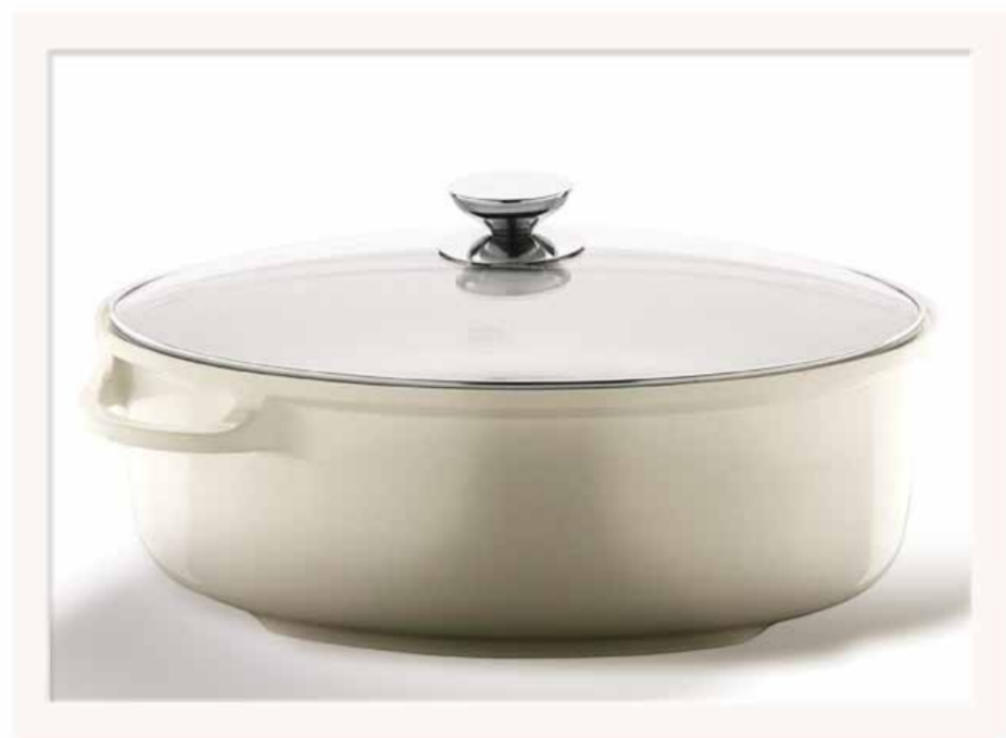
Linea SPECIALI: Rostiera ovale 38X24 cm con rivestimento in ceramica bianco e coperchio in vetro.