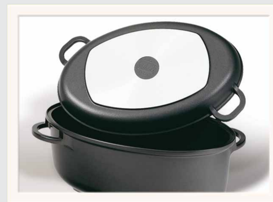
Linea SPECIALI: Rostiera ovale 38X24 cm e coperchio in pressofusione.