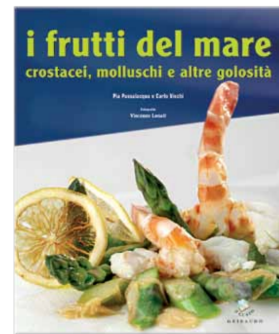
Volume all'interno della confezione regalo "Piatti da Chef - il Pesce"