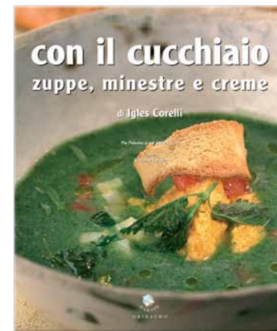
Volume all'interno della confezione regalo "Piatti da Chef - la Zuppa"